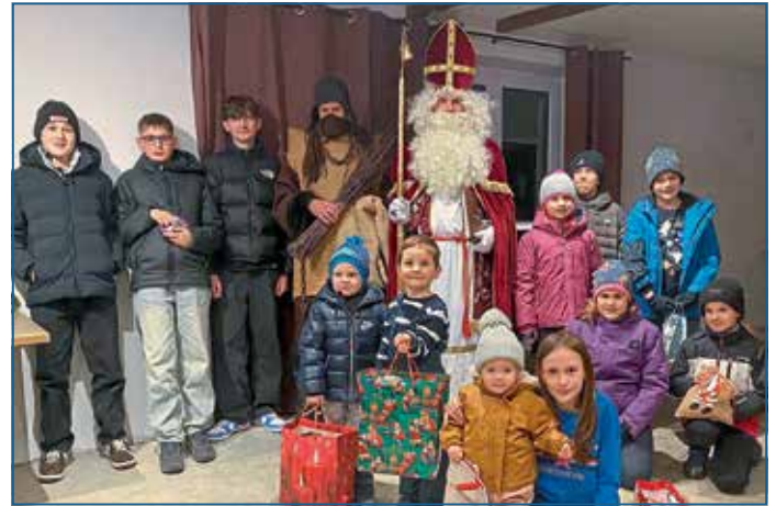
Der Nikolaus kam zu den Kindern nach Pettling.

info@mayer-huber.vkb.de · www.mayer-huber.vkb.de www.facebook.com/mayer-huber