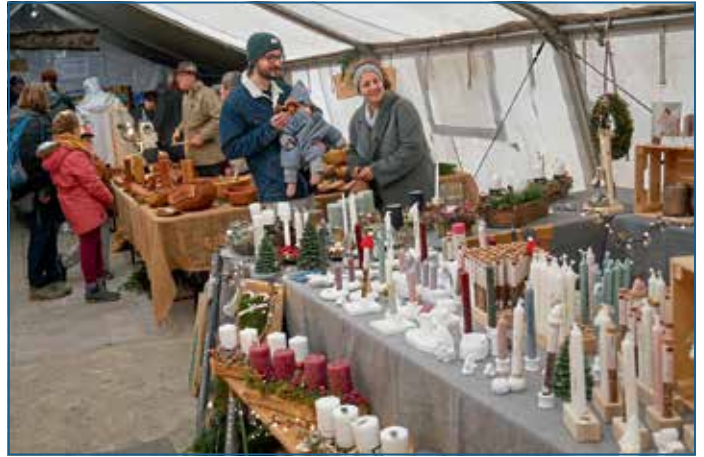
Eindrücke vom Kunsthandwerkermarkt.