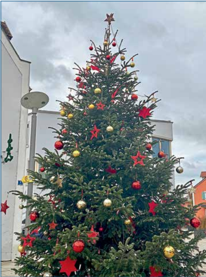
Christbaum am Marienplatz Vielen Dank für's Schmücken und Dekorieren!