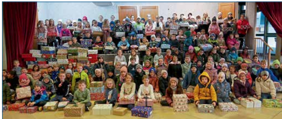
Viele, schön verpackte Päckchen übergaben die Großmehring Schwestern und Schüler an die Organisation „Humedica“, die sie nach Osteuropa bringt.

Humedica ist eine internationale Hilfsorganisation mit Sitz in Kaufbeuren. Seit 1979 leisten sie schnelle Not- und Katastrophenhilfe