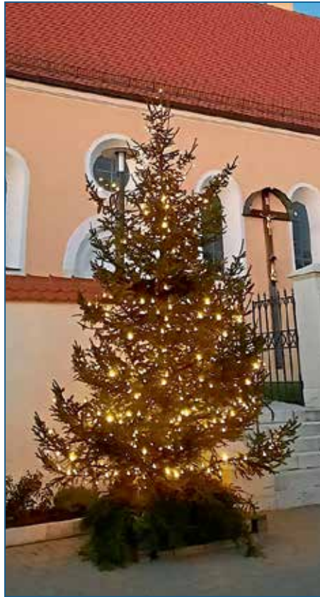
In Pettling erstrahlt auch dieses Jahr wieder ein Christbaum. Vielen lieben Dank an die ehrenamtlichen Helfer!