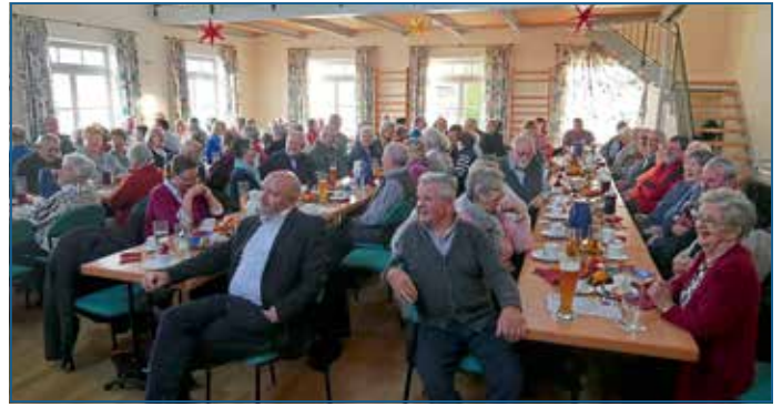
106 Besucher erlebten bei der VdK-Adventfeier einen unterhaltensamen Nachmittag.

In seiner Begrüßungsrede sprach Jobst die Diskussionen um das Bürgergeld an. „Vor allem von einer großen deutschen Tageszeitung mit vier Buchstaben wird hier ständig Stimmung dagegen gemacht“, beklagte er. Das beruhe aber auf falschen Annahmen. Nur etwa 15.000 aller Bürgergeldempfänger seien wirklich arbeitsunwillig. Auch die Armut im doch eigentlich so reichen Deutschland sprach der Vorsitzende an. „Zwischen 18 und 20 Prozent aller Familien in Deutschland sind von Armut betroffen“, beklagte er. Hier setze auch die jährliche VdK-Haussammlung an. 1490 Euro brachten die vier Samm-