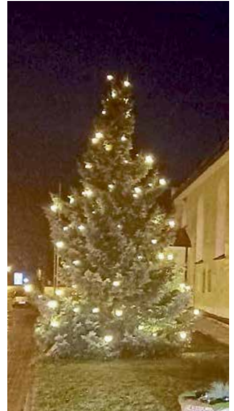
Christbaum in TheiBing Vielen Dank für's Schmücken an alle Helfer.